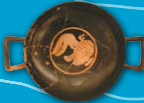
Kylix ático de figuras rojas Cerámica Illeta dels Banyets ( El Campello ) 1ª mitad del S.IV a.C.