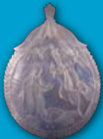
Medallón ( Venera ) Nácar Colección Beltrán - Ausó S. XVIII