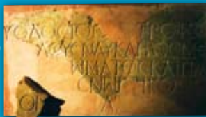
Inscripción griega de un armador Marmol Tossal de Manises ( Alicante ) S. II d.C.