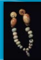
Collar Necrópolis de la Albufereta ( Alicante ) Ibérico pleno -S. IV-III a.C.