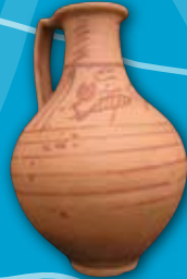
Olpe Cerámica Portus Illicitanus ( Santa Pola ) S. I - II d.C.