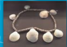
Collar de conchas Glycymeris sp. Serra Grossa ( Alicante ) Edad del Bronce