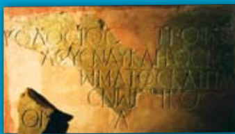
Inscripción griega de un armador Marmol Tossal de Manises ( Alicante ) S. II d.C.