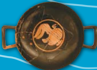
Kylix ático de figuras rojas Cerámica Illeta dels Banyets ( El Campello ) 1ª mitad del S.IV a.C.