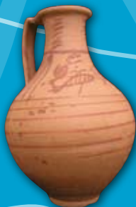
Olpe Cerámica Portus Illicitanus ( Santa Pola ) S. I - II d.C.