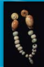
Collar Necrópolis de la Albufereta ( Alicante ) Ibérico pleno -S. IV-III a.C.