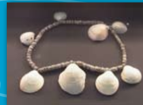
Collar de conchas Glycymeris sp. Serra Grossa ( Alicante ) Edad del Bronce