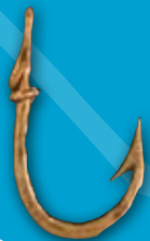
Anzuelo Bronce Baños de la Reina ( Calpe ) Romano Bajoimperial ( Siglo IV d.C.)