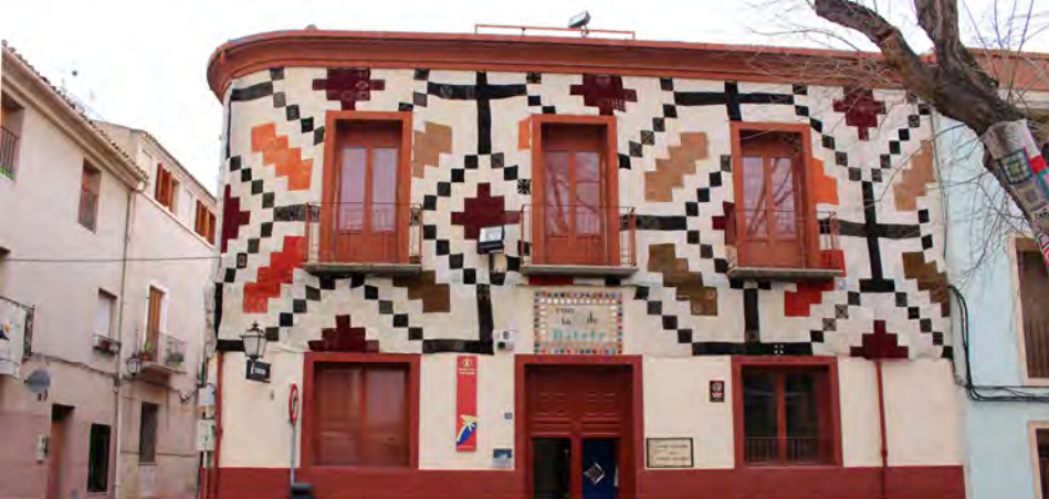
Grupo Arqueológico y Museo Dámaso Navarro