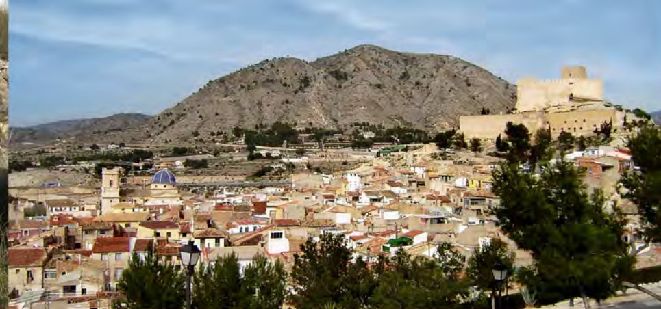
Edad Media y Moderna