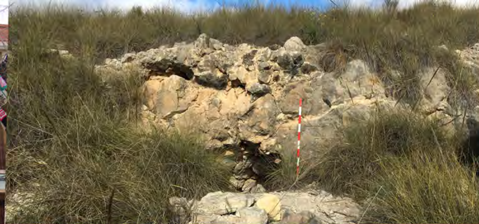
Prehistoria, periodo ibérico y romano