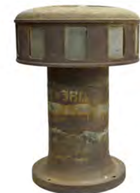
Arriba: Rodando falles en el Derrocat a la espera de los Reyes Magos.

El patrimonio inmaterial petrerense viene marcado por festividades como las fiestas de moros y cristianos, les falles y les carasses , todas acompañadas por la música tradicional.