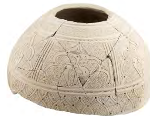
Arriba: Vista del centro histórico de Petrer.

En época bajomedieval Petrer pasó a formar parte del reino castellano y, a partir de 1305, con el Tratado de Elche, del aragonés. Fue propiedad de la familia Loaysa, después de los Corella y por último, desde 1513, perteneció a la familia Coloma. La expulsión de los moriscos en 1609, hizo que Petrer perdiera casi toda su población. Los repobladores, procedentes de localidades vecinas, trajeron sus costumbres y fueron edificando sus casas dando lugar al actual centro histórico.