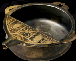
Decantador de bronce

El Tesoro de Neupotz está compuesto por cerca de 1.100 objetos, de los cuales más de la mitad se exponen en el MARQ junto a otros tesoros como el de Hagenbach y el de Lingenfeld. Estos tesoros o "botines" están formados por una amplia variedad de objetos, desde piezas usadas en la vida cotidiana, como lo era la vajilla de mesa o las herramientas de trabajo, hasta elementos de prestigio tales como las armas o las joyas.