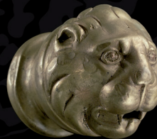
Remate decorativo con cabeza de León en bronce

Además de la presentación de una destacada selección de objetos originales del magnífico conjunto del Tesoro de Neupotz, la exposición se acompaña de recreaciones que trasladan al visitante a una pequeña ciudad romana en pleno s.III. El público, además de poder admirar las piezas, podrá pasear por un mercado, hacer ofrendas en un templo o caminar por una calzada romana que le conducirá de regreso a la "Germania libre" con un carro cargado con su botín.