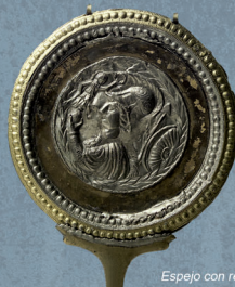
Espejo con relieve de la diosa Minerva

La desigual incidencia de la crisis del siglo III en el Imperio se manifiesta en nuestras tierras, pues aquí no hubo invasiones bárbaras en este momento. El establecimiento de un destacamento militar en Dianium se relaciona con las luchas por el poder imperial, que quizá fueron la causa de la ocultación de 668 sestercios de bronce halladas en Denia. Pese a la recesión económica y edilicia, siguen activas las ciudades de Ilici y su puerto, La Vila Joiosa ( Allon? ) y Dianium , pero se abandona Lucentum , que desde el s. I mostraba signos de recesión, debido a problemas económicos de ámbito regional. En el entorno rural, algunas villae , dedicadas a la producción de vino y aceite, son ahora más lujosas y cómodas que en siglos anteriores. Las primeras invasiones se documentan a principios del siglo V, protagonizadas por Alanos y Vándalos.