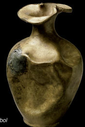
Jarra de bronce con borde en forma de trébol