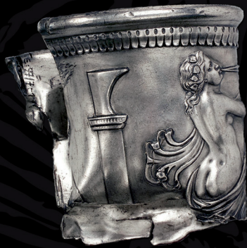
Copa de plata

Con la exposición El Tesoro de los Bárbaros , el Museo Histórico del Palatinado de Speyer (Espira, Alemania) y el MARQ (Alicante, España) presentan por primera vez en nuestro país el espectacular hallazgo del Tesoro de Neupotz. Este asombroso descubrimiento bajo las aguas del Rin sacó a la luz uno de los mayores conjuntos de metal de época romana de toda Europa.