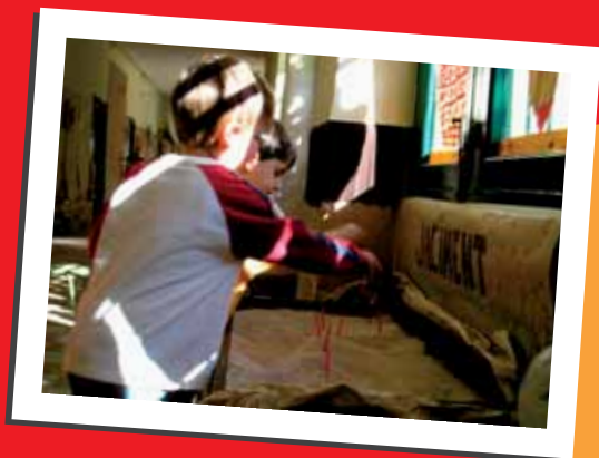
CP Joaquín Sorolla

Desarrollo: consiste en la visita al MARQ, con realización de taller y regalos de Llumiq