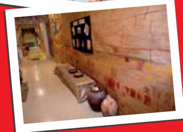
pasillos ambientados en el CP Albufereta

Desarrollo: consiste en la visita al MARQ, con realización de taller y regalos de Llumiq