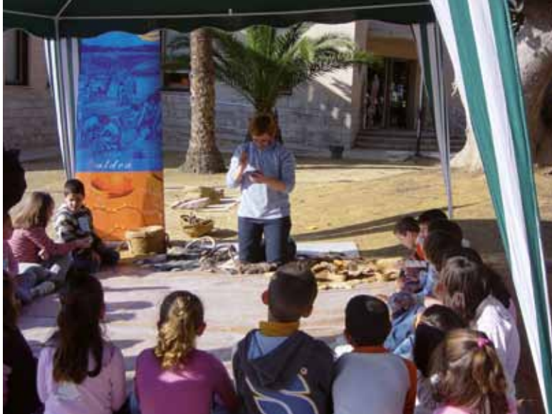
Figura 5. Taller didáctico en los jardines del MARQ, marzo 2007.

El taller de Pegli guardaba una vocación formativa especializada a la vez que internacional, beneficiándose el Museo y la Universidad de Alicante de varias becas de asistencia, del todo interesantes para la formación de los asignados. Con todo, uno de los logros más notables fue la apertura de la Grotta dell'Archeologia , como espacio didáctico dedicado a la Arqueología Experimental que aprovecha el refugio antiaéreo del parque di Villa Doria, espacio que evoca al de las grutas prehistóricas ligures y que ahora se destina como un aula didáctica de primaria y secundaria donde en visitas de 2 h se prueban y experimentan prácticas relacionadas con los sistemas de preparación y conservación de alimentos, la producción alfarera o textil, o el trabajo de las conchas, como vía idónea para aproximar a los alumnos a la vida cotidiana en aquellas cavidades neolíticas.