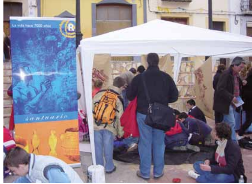
Figura 4. Taller didáctico en la plaza de Castell de Castells, marzo 2007.

de Alicante. Esta afortunada prórroga se ha considerado necesaria, teniendo en cuenta no solamente el esfuerzo invertido en su realización sino también la validez de mucha de la información que recoge una vez que, además del calendario de acciones que se desarrollaron en el proyecto, la página da información en cuatro lenguas –inglés, francés, español e italiano - de los objetivos del Reality, los socios y del Neolítico de cada una de las áreas contempladas, disponiéndose imágenes de objetos como las pintaderas y las trompetas de concha asimiladas al Neolítico Ligur y de hallazgos in situ del yacimiento francés de Chalain tan impresionantes como el hacha enfundada en asta de ciervo para de ese modo quedar sujeta a un mango de madera de fresno, o los restos constructivos en madera de una considerable cabaña, de la que se sugiere también su reconstrucción; junto con piezas neolíticas del MARQ, imágenes del video que en la sala de exposición permanente se destina a las tecnologías propias de los primeros agricultores y ganaderos, además de información detallada del Santuario de Pla de Petracos, la Sala de Arte Rupestre que le asiste en Castell de Castells y el montaje expositivo que, en relación con la Cova de l'Or, se dispone en Beniarrés.