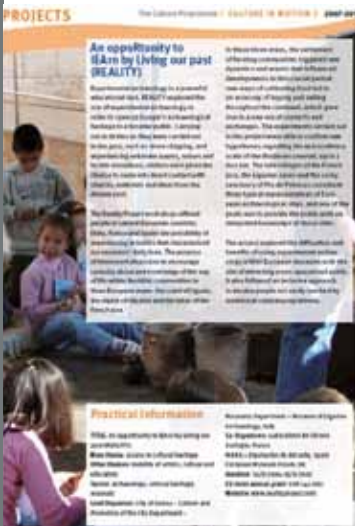
Figura 2. The Culture Programme-Culture in Motion - Luxembourg: Office for Official Publications of the European Communities, 2008, (ISBN 978-92-79-09513-9), p. 53

A lo largo de 12 meses de trabajo distribuidos en los ejercicios de 2006 y 2007 –16/8/2006-15/8/2007– los socios del proyecto debían acometer talleres didácticos en cada una de sus sedes que abordaran aspectos referidos al hábitat, subsistencia, tecnología o arte. Dichos talleres podían acompañarse de seminarios con una temática centrada en el Neolítico, la Arqueología experimental y la Didáctica, completándose esas realizaciones con la redacción de un documento de recomendaciones a modo de vademécum sobre la buena práctica y metodología de la arqueología experimental y la realización de una página web que permitiera transmitir la información sobre los socios, sus acciones, una sucinta aproximación al Neolítico de cada una de las regiones -Jura, Liguria y Valencia- y de las diferentes actividades que se realizaran en el transcurso del proyecto. De todo ello se ofrece buen resumen en una edición de la Comisión Europea (Fig.2) cuyo contenido se transcribe: