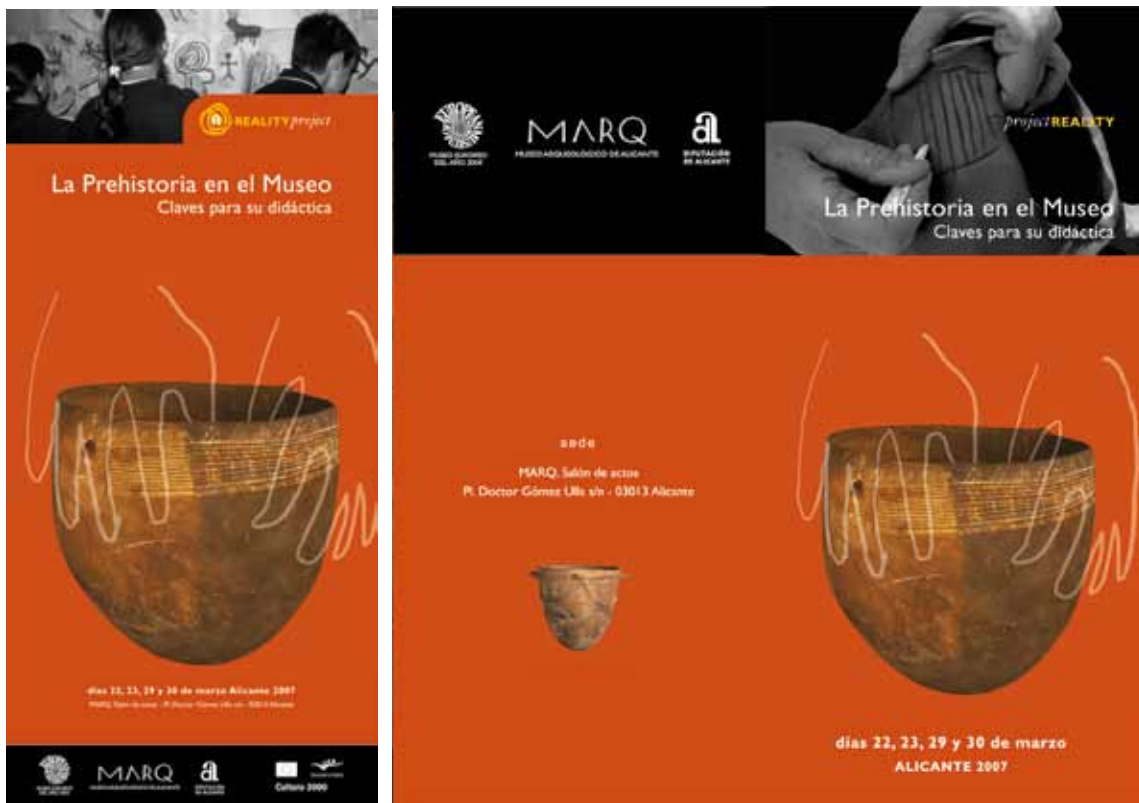
Figura 7. Folleto y poster de acciones del MARQ en el proyecto Reality.

importancia a la habitación aldeana, tampoco alcanzan los contenidos que una década antes el mismo Museo de Prehistoria resolvía en el catálogo que, suscrito por B. Martí y J. Juan, resultó de la magnífica exposición El Neolític Valencià. Els primers agricultors i ramaders (Valencia, 1987) (5).