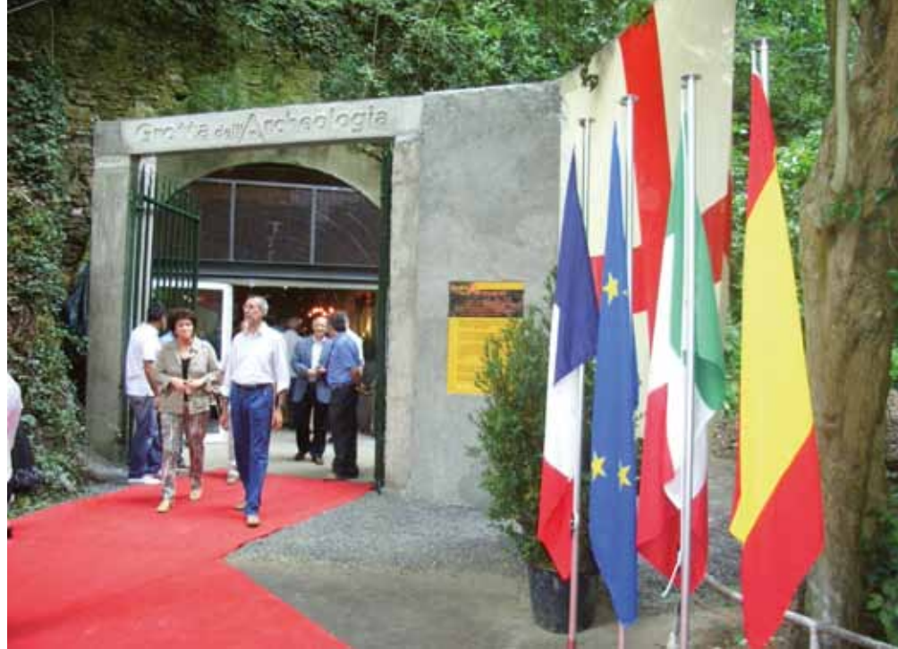
Figura 1. Interior y exterior de la Grotta dell'Archeologia. Génova, junio 2007.