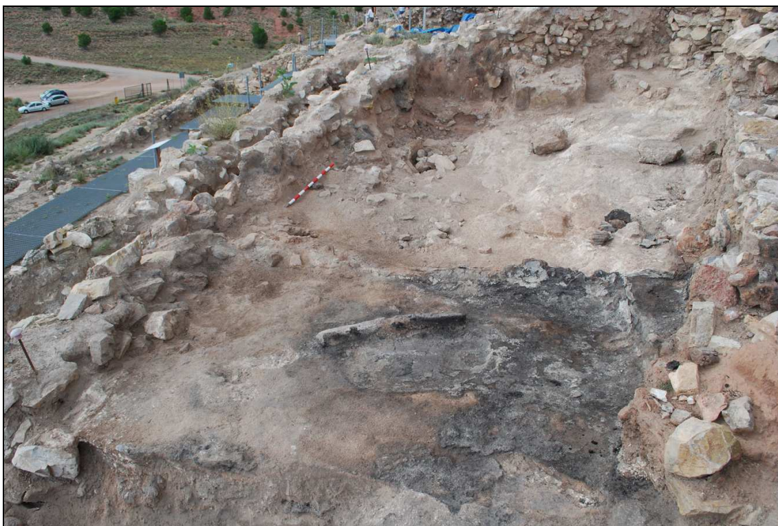
Departamento XXIX. Vista del corte 3 al final de la excavación.