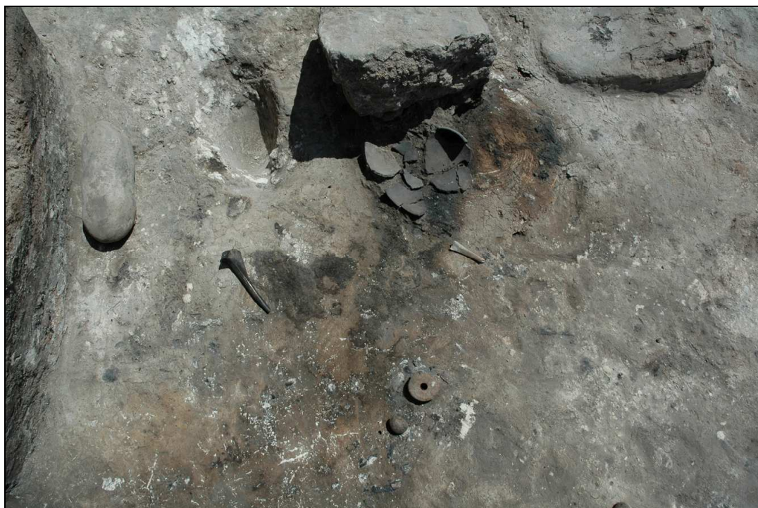
Dispersión de materiales sobre el pavimento de la fase antigua del departamento XXIX.