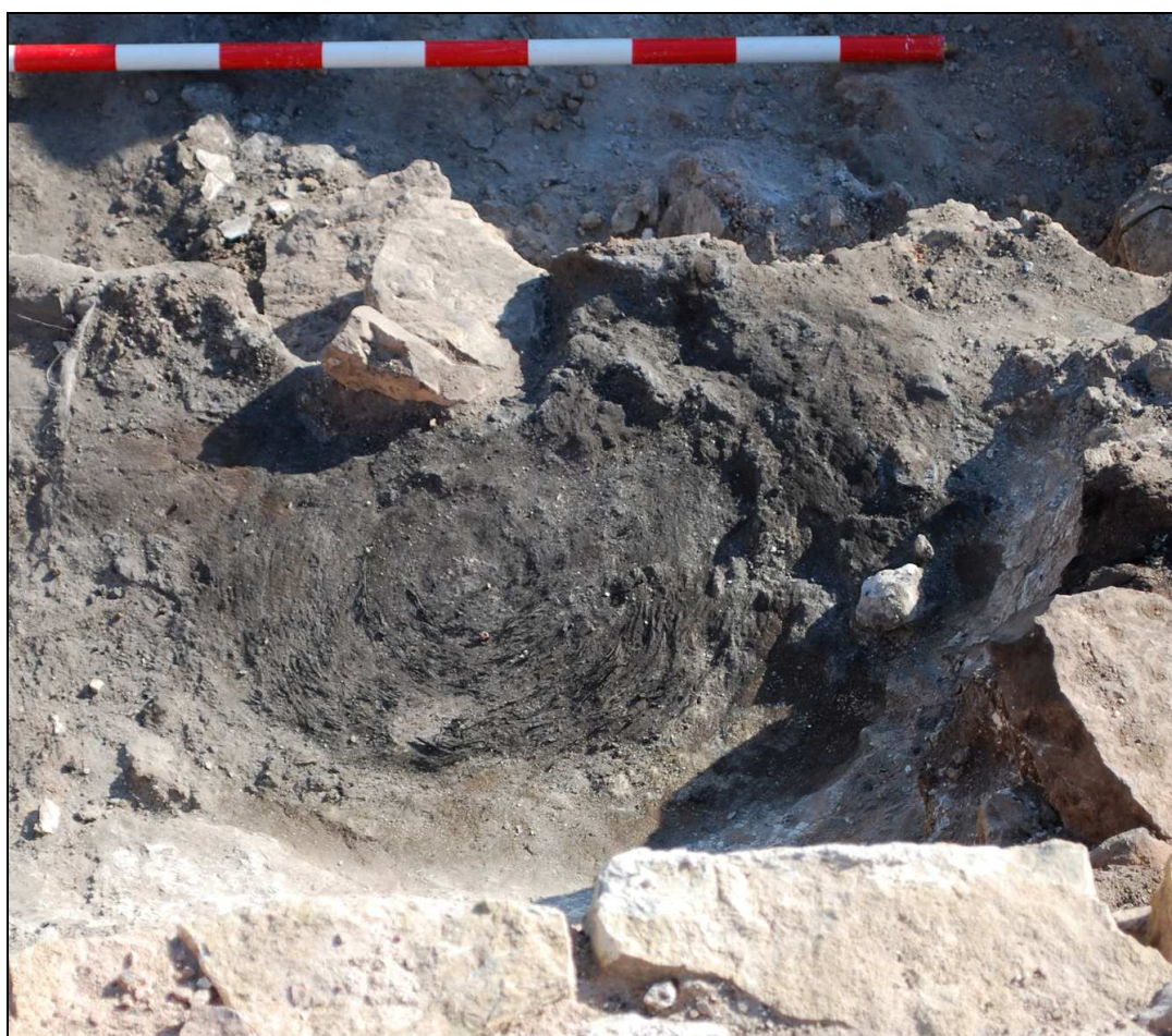
Estera de esparto carbonizada sobre uno de los bancos de barro del departamento XXVII.