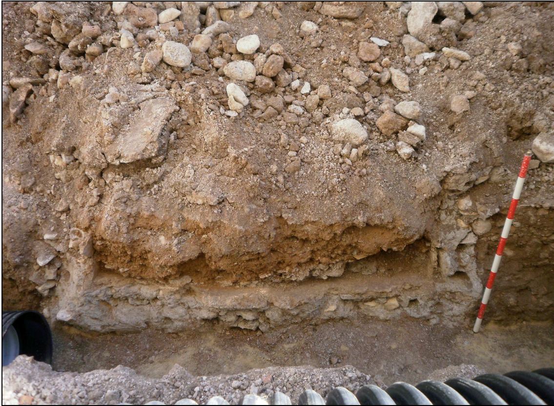
Detalle del semisótano de la vivienda demolida cortado por el antiguo alcantarillado.