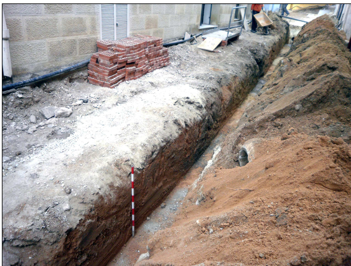
Vista de la zanja para la introducción del tubo del alcantarillado.