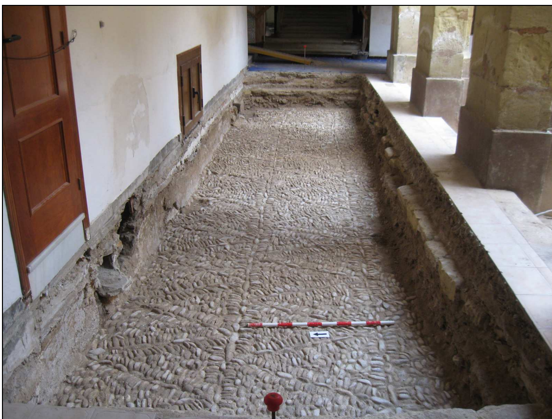
Vista del pavimento de cantos rodados exhumado en el sondeo abierto en el claustro.