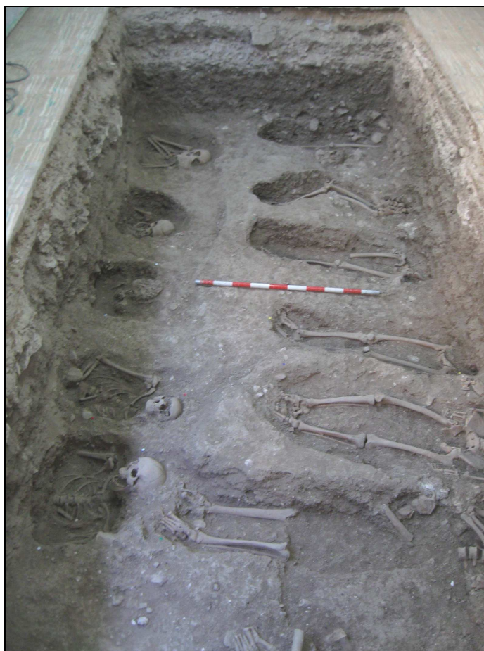
Vista de las inhumaciones de la habitación 2.