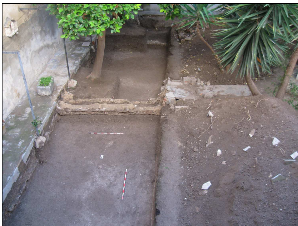
Vista de la excavación de la zona del huerto, sector A.