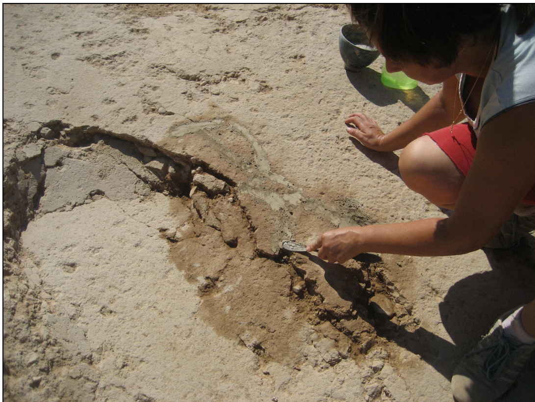
Consolidación del pavimento del oecus .