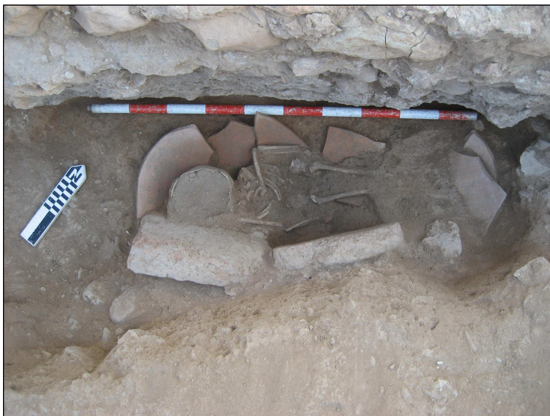
Enterramiento infantil nº 3.