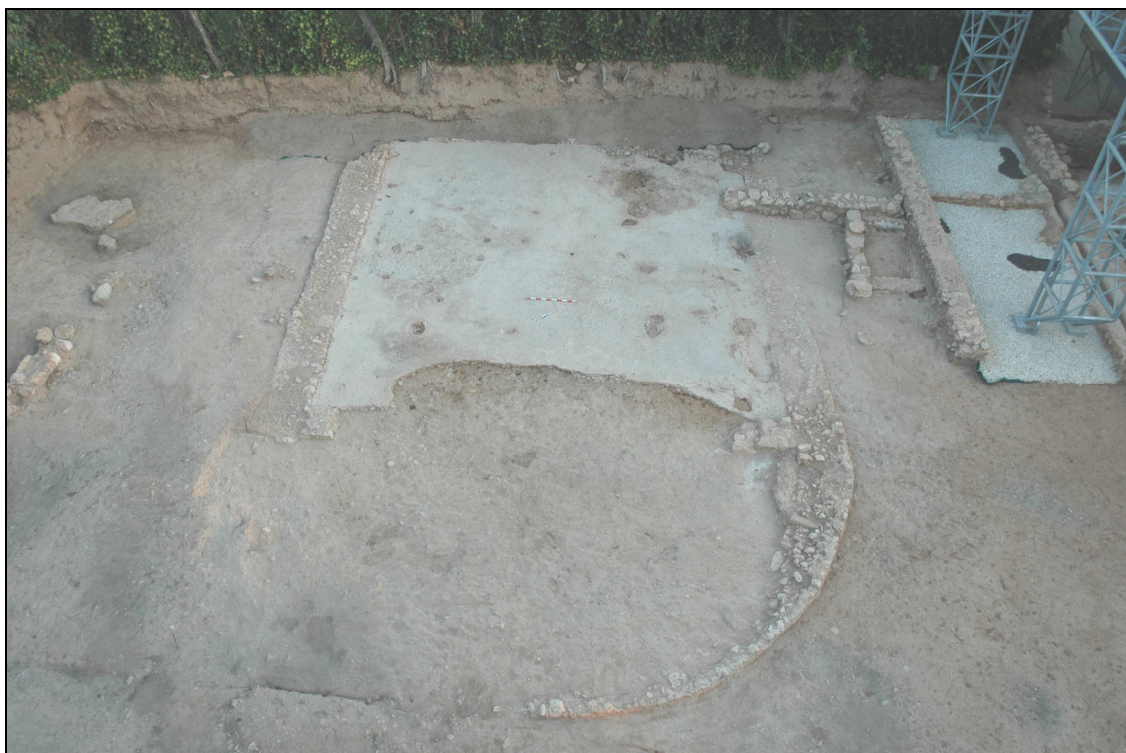
Vista del oecus .