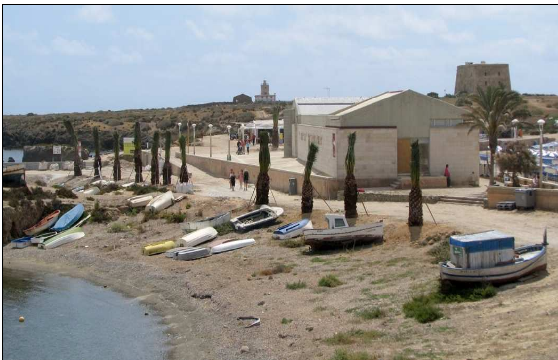
Panorámica del área de actuación.