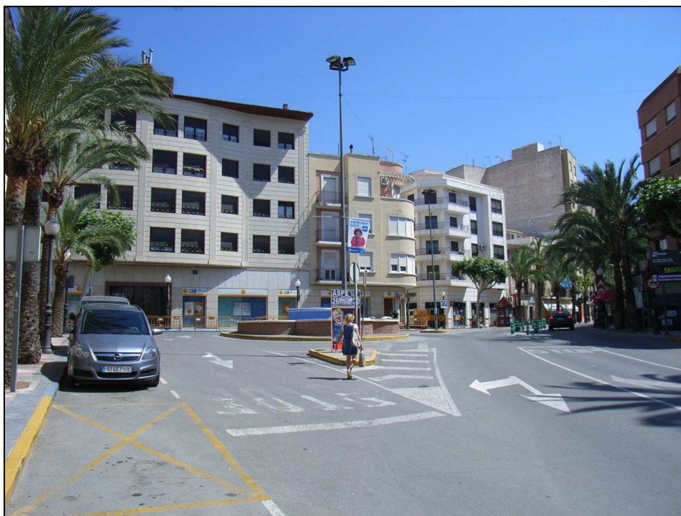
Vista parcial del área de intervención.