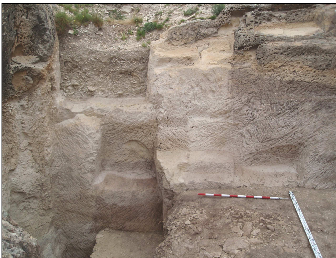
Frente de talla occidental.