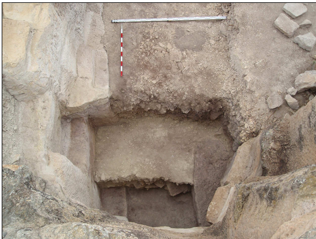
Vista desde el sur de la cantera al finalizar los trabajos de 2011.