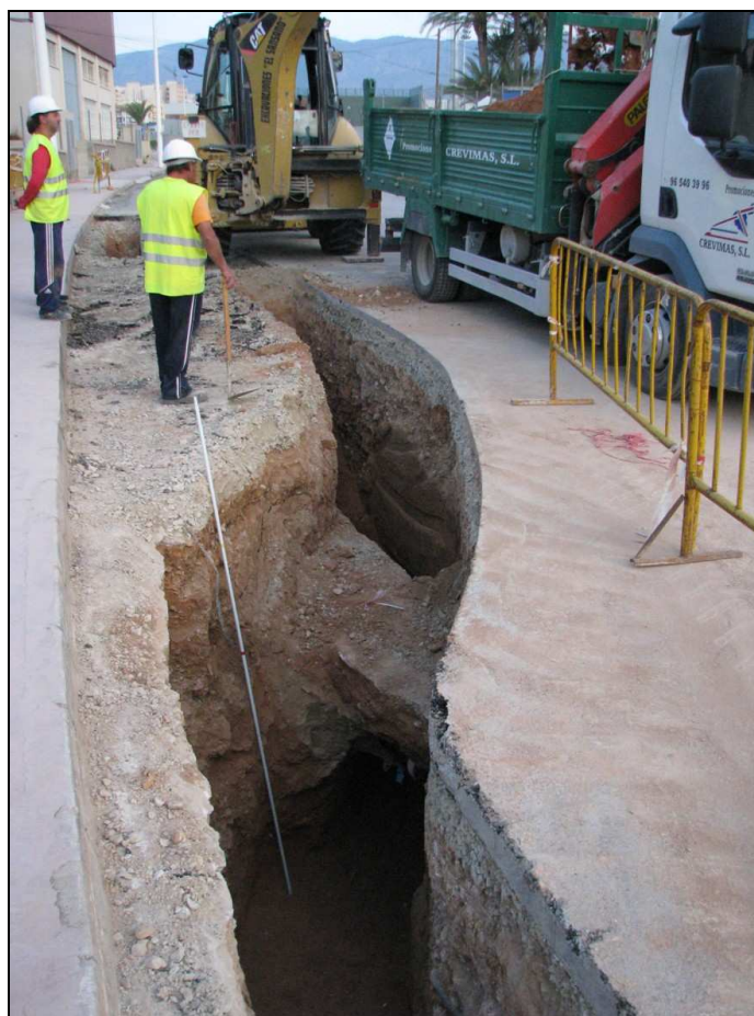
Vista del tramo I de la zanja.