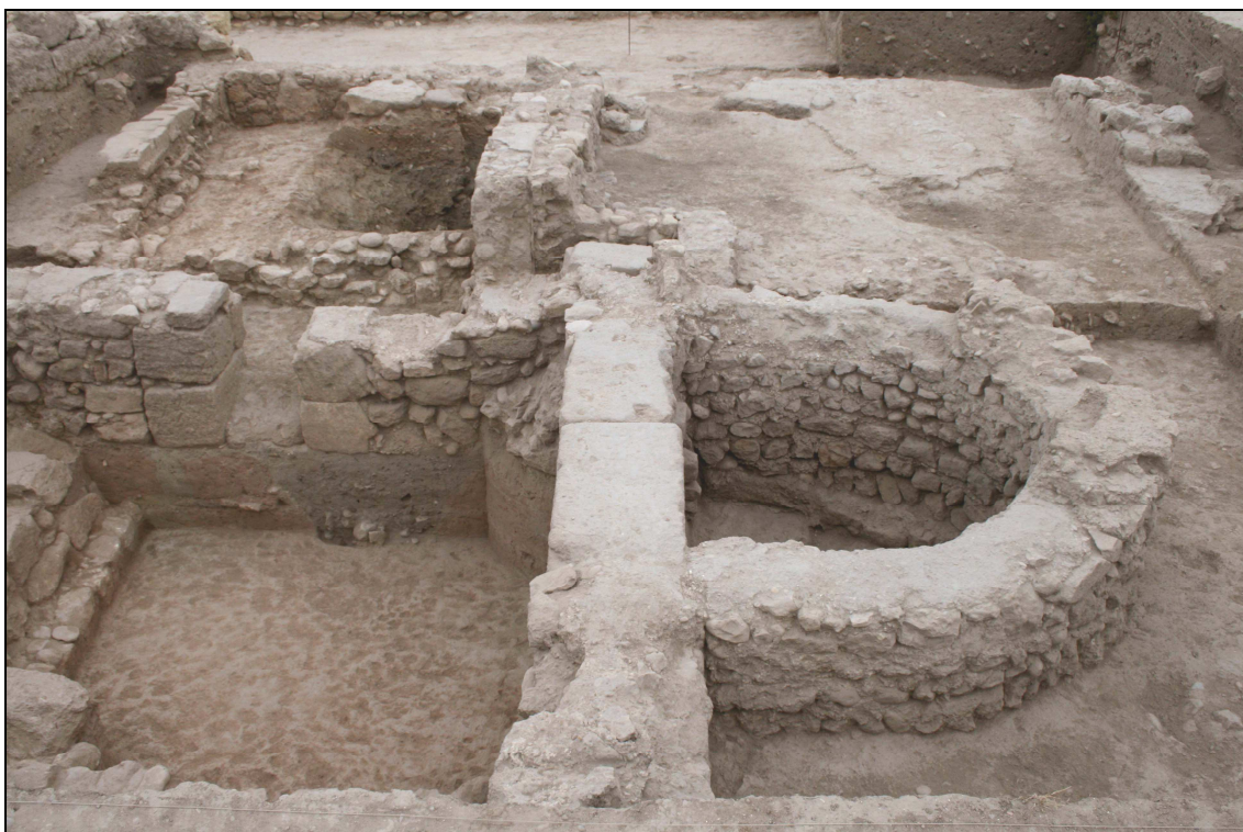
Vista desde el sur de parte del caldarium y, en primer término, el ábside que se abre en su pared oriental.