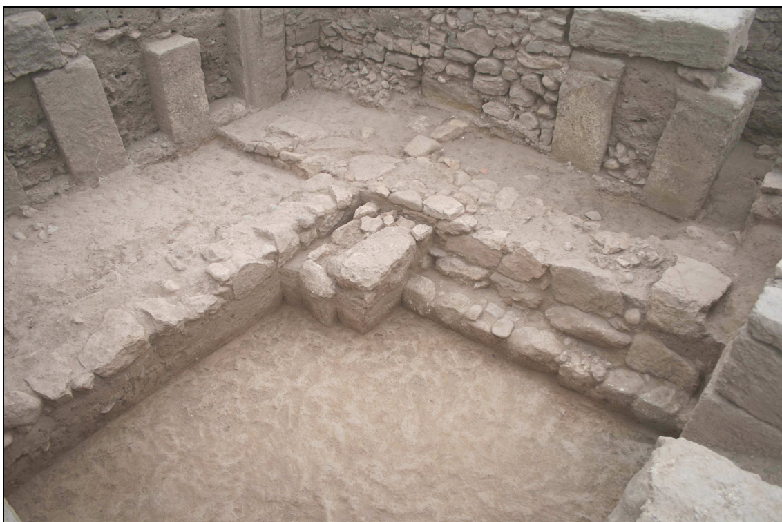
Vista desde el noreste de la fase ibérica en las cotas más bajas de la excavación.