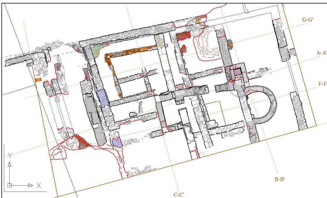
Plano general del sector. Proyecto Casas ibéricas 2011.