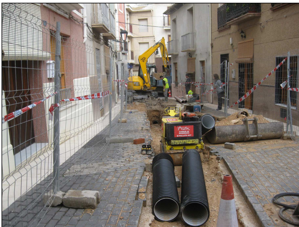
Vista parcial de la zona de actuación.