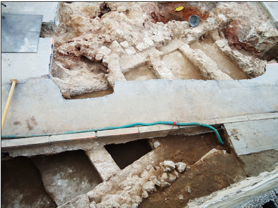
Panoràmica de les estructures pertanyents a la petita factoria de salades descoberta.