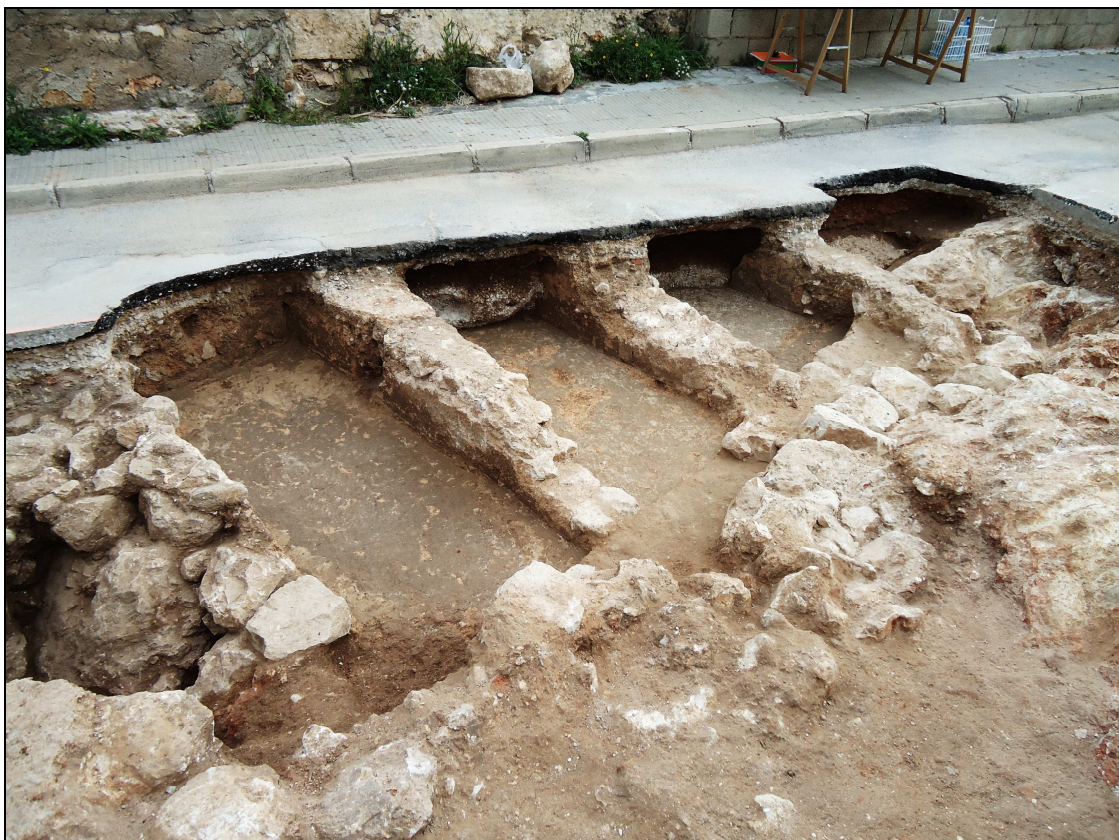
Vista de la batería de piletes contigües de la factoria de saladures.