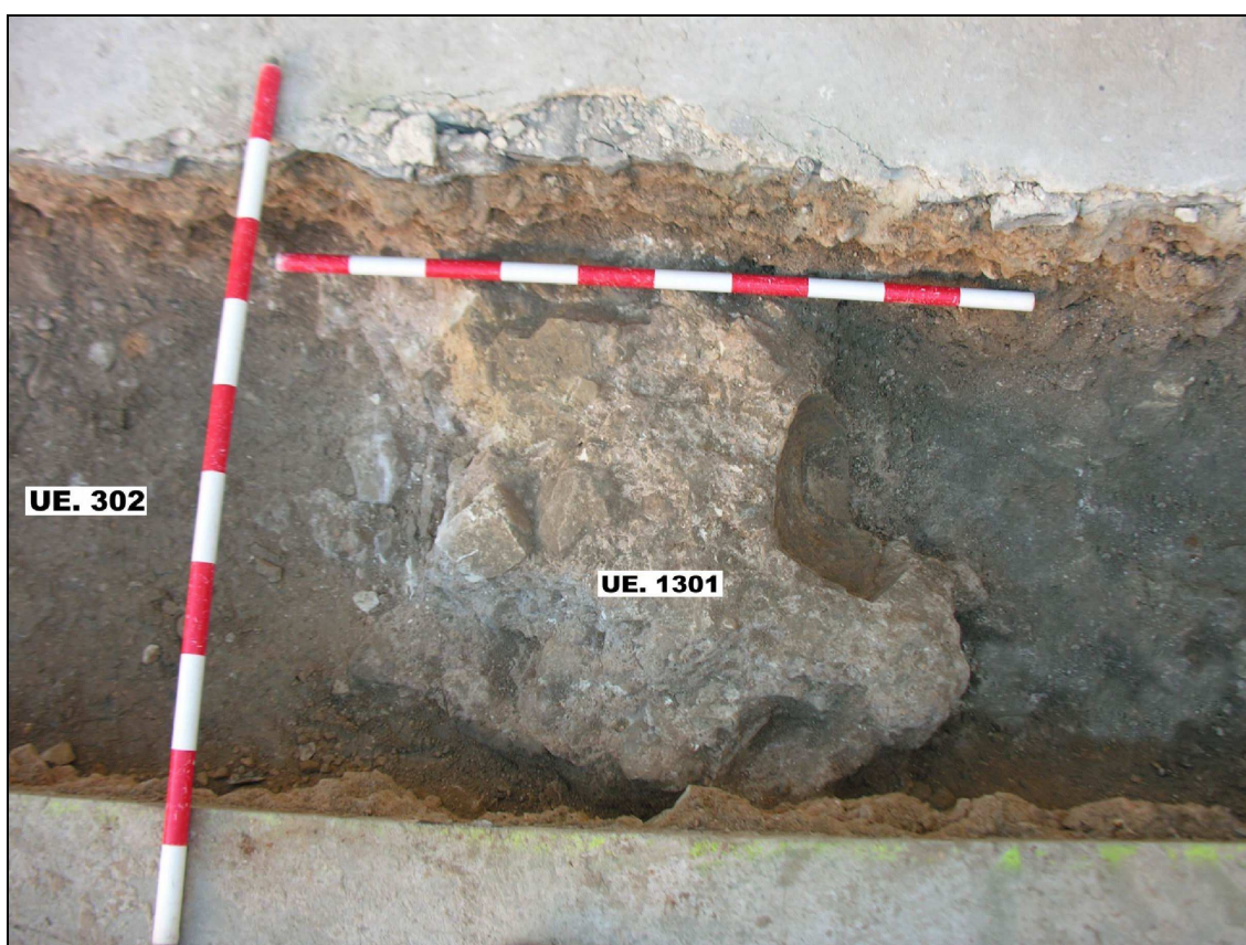
Detalle del muro UE 1301.