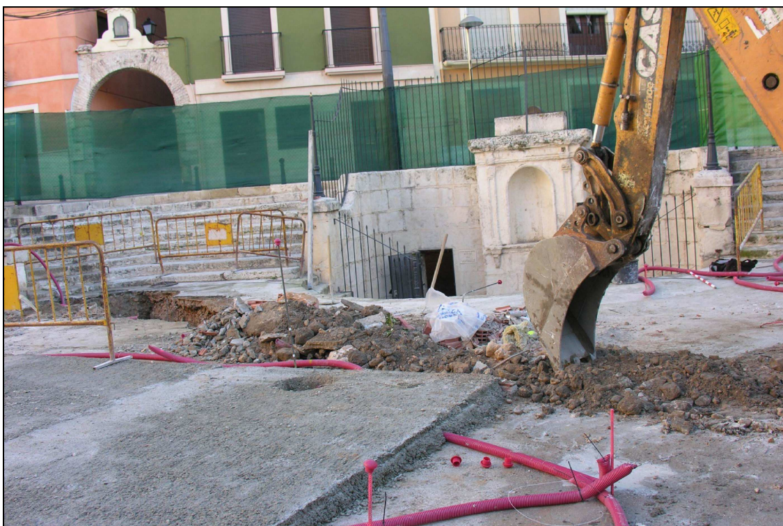
Vista de la apertura de una de las zanjas.