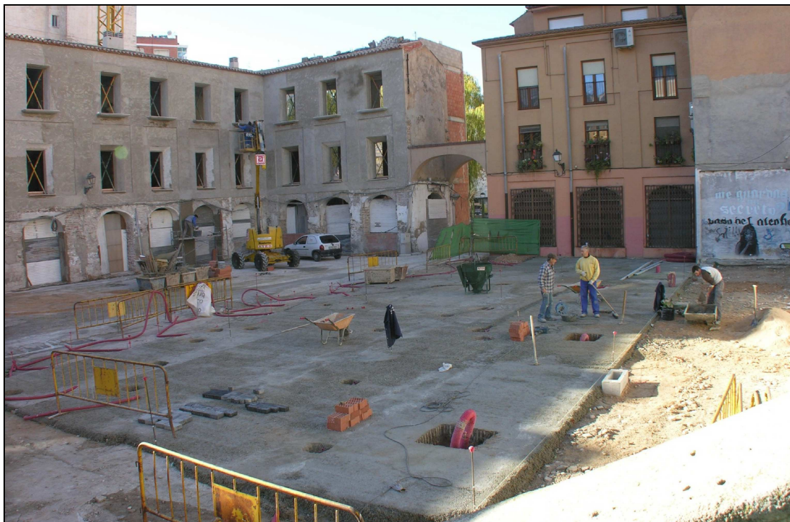
Panorámica de la plaza Mayor de Villena.