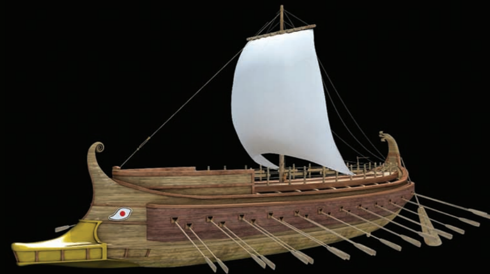
Recreación hipotética de Birreme