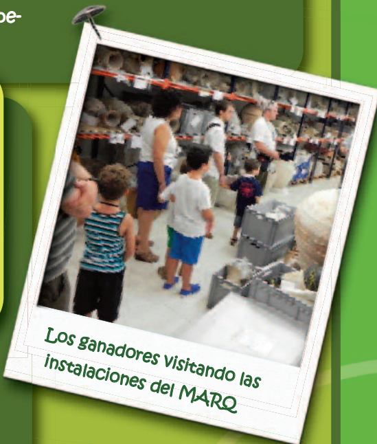
Los ganadores visitando las instalaciones del MARQ