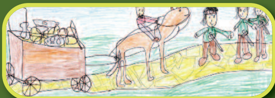
Autor: Carlos Zeeb