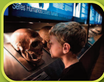
Autor: César Jiménez Ruiz Título: Seres humanos