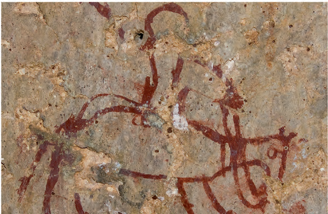
2. Castillo Atalaya