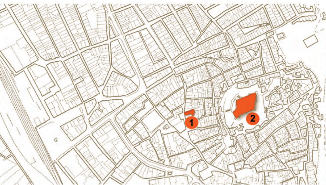
1. Ermita de San Antón

Además de comprender su significado y potenciar su conservación, uno de los aspectos más relevantes del estudio de los grabados es la información cronológica que pueden proporcionar. Por lo que respecta al corpus de grafitos villenense abarca desde el siglo XIV, fecha atribuida al grabado de la Mano de Fátima del Castillo de la Atalaya hasta el presente, pasando por otros epigráficos realizados durante las contiendas de la Guerra de Sucesión y de la Independencia por los prisioneros cautivos en la torre del castillo.