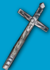
Cruz Madera y nácar Colección Fondo Histórico S. XIX