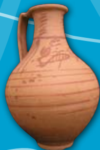
Olpe Cerámica Portus Illicitanus ( Santa Pola ) S. I - II d.C.